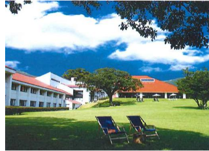
箱根ハイランドホテル 〒250-0631 神奈川県足柄下郡箱根町仙石原品の木 940 TEL 0460-84-8541