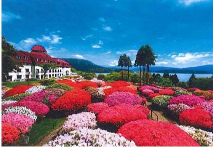
箱根（芦ノ湖畔）小田急 山のホテル 〒250-0522 神奈川県足柄下郡箱根町元箱根 80 TEL 0460-83-6321