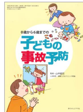
子どもの事故予防