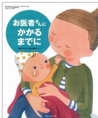
お医者さんにかかるまでに