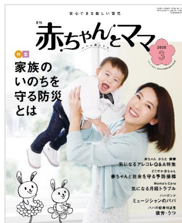
月刊誌 赤ちゃんとママ